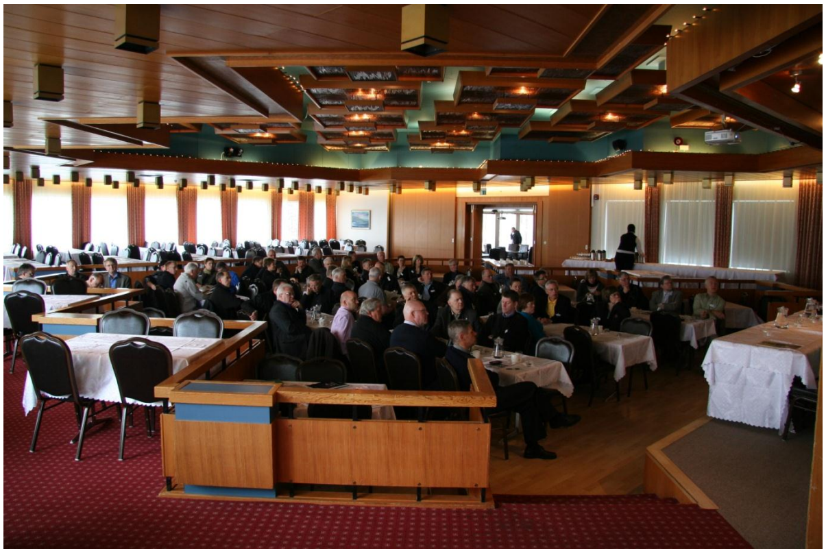
Aðalfundarfulltrúar KGSÍ á Húsavík 28. maí 2011