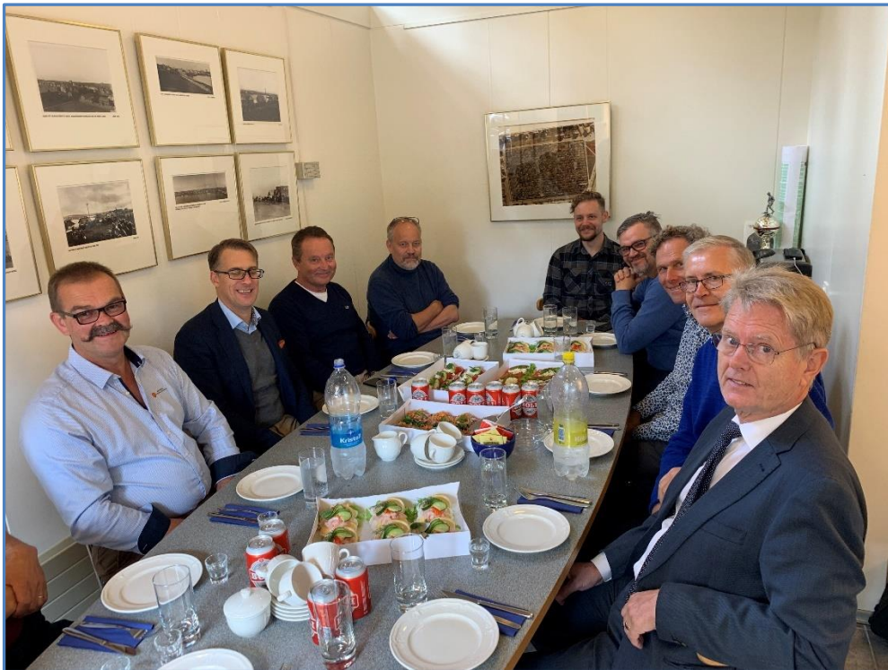
Hádegisfundur í stjórn NFKK haldinn í þjónustuhúsinu í Hólavallagarði 23. ágúst 2019.

Haldnir eru 1-2 fundir á ári og eru fundarstaðir gjarnan höfuðborgir Norðurlandanna á víxl. Á þessum fundum er tekið fyrir það helsta sem er að gerast í þessum málaflokkum á Norðurlöndunum. Tveir fundir voru haldnir árið 2019. Fyrri fundurinn var haldinn 21. janúar í Ribe í Danmörku. Forstjóri KGRP og framkvæmdastjóri kirkjugarðaráðs sóttu fundinn fyrir Íslands hönd. Seinni fundurinn var haldinn í Reykjavík 22. og 23. ágúst og var stjórn KGSÍ þá í hlutverki gestgjafans.