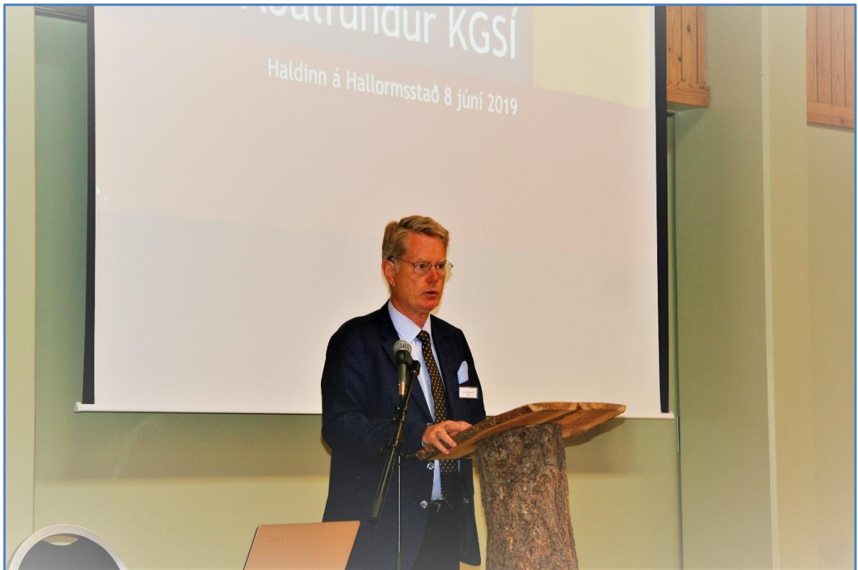
Formaður KGSÍ setur aðalfundin á Hallormsstað laugardaginn 8. júní 2019.

Tuttugasti og fjórði aðalfundur KGSÍ var haldinn á Hótel Hallormsstað 8. júní 2019 og voru fundarmenn 44 og með mökum um 70 talsins. Fundurinn var haldinn í björtu og fallegu veðri. Fjármál kirkjugarða voru fyrirferðamikil eins og venjulega og lagt var á ráðin hvernig best væri að ná eyrum ráðamanna.