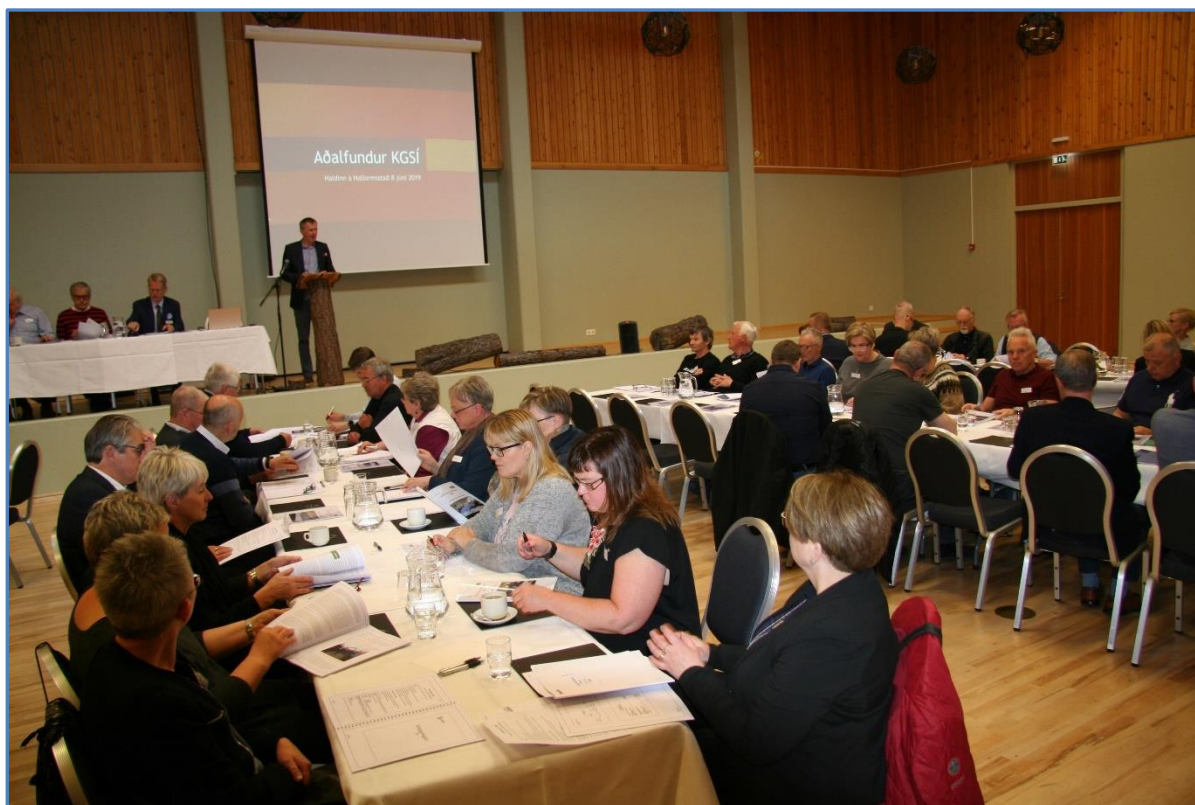
Aðalfundur KGSÍ var haldinn á Hallormsstað 8. júní 2019.